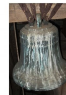
petite cloche—Diamètre 420 mm