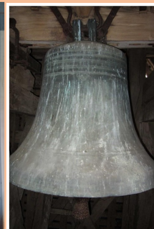
Grande cloche—Diamètre 1010 mm