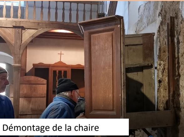
Démontage de la chaire